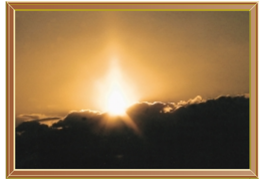
元旦の太陽柱 (平成22年1月) 撮影場所 妙正寺(本町二丁目)