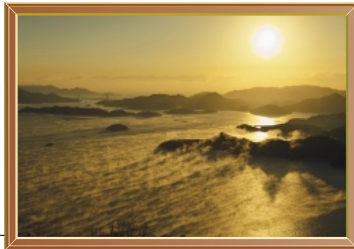
海霧 (平成22年12月) 撮影場所 筆影山展望台

市民の皆さんからの投稿写真を 紹介します。 作品は随時募集しています。たく さんの応募を待っています。