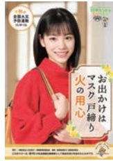
↑秋の全国火災予防運動ポスター

☎ 消防本部予防課(TEL 0848-64-5927 FAX 0848-62-5119)