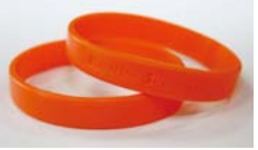
▲受講者に認知症サポーターの証「オレンジリング」を交付