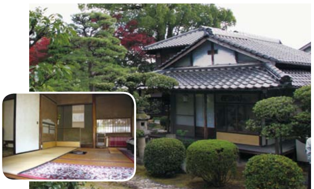
▲江戸時代をしのばせる茶室や庭園が見学できます

今年2月、県内で初めて国の登録記念物に登録された、松木氏庭園の特別公開を行います。江戸時代をしのばせる茶室や庭園を見学してみませんか。 とき 12月4日(日) ①10時～12時 ②13時～15時 ところ 松木氏庭園(西町二丁目) 定員 500人(申し込み先着順) 参加費 300円 ※駐車場はありません。できるだけ公共交通機関を利用してください。 申し込み 18日(金)(必着)までに、はがきかファクスで、住所、名前、電話番号、見学を希望する時間を生涯学習課(〒723-0015 一町二丁目3番1号 ☎0848-642137 FAX 0848-60137)へ