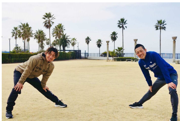
【鳥谷氏（左）と板倉社長】