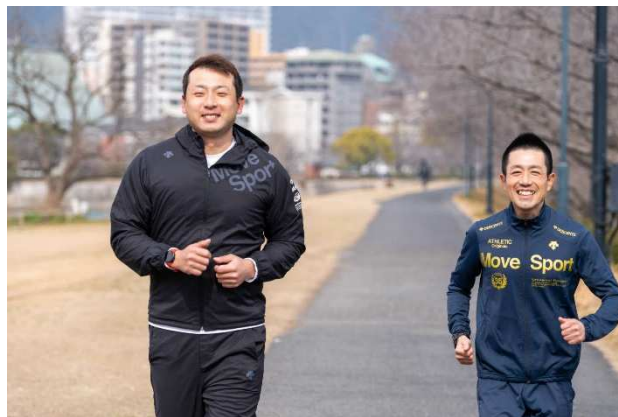
【今村氏（左）と板倉社長】