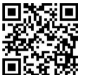
もうしこみ (申込フォーム)