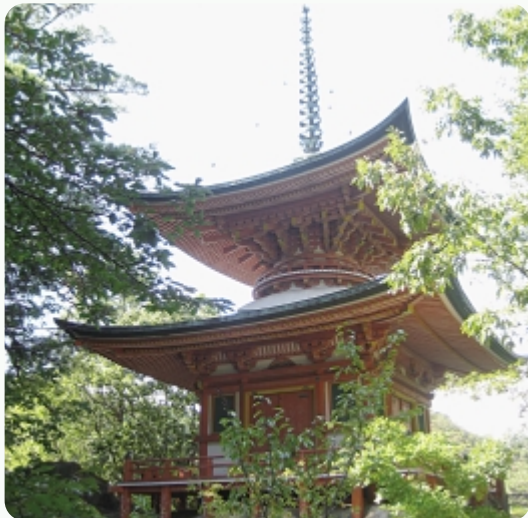
▲近代的な建築要素を持つ佛通寺多宝塔

佛通寺多宝塔は、昭和2年に建築され、佛通寺の境内の高台にあります。上層部が円形、下層部が方形の木造の二層塔で、間口・奥行きとも4.2m、建築面積は18.23㎡です。かえる股や木鼻など、細部にまで流麗な彫刻が施されています。全国的にも数少ない昭和前期の多宝塔で、当時の建築技術を知る上でも貴重な建物です。