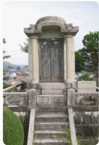
▲当時としては珍しいギリシャ風建築様式の奉安殿

間口・奥行きとも1.7m、建築面積2.91㎡、高さ3.4mの石造建築で、和風神社建築様式が多かった当時には珍しい、優美なギリシャ風建築の様式を示しています。