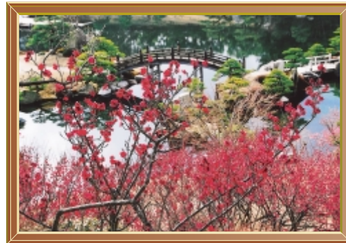
満開の梅 (平成23年3月) 撮影場所 三景園(本郷町善入寺)