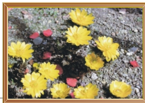
春と幸せを感じる花・福寿草 (平成23年2月) 撮影場所 中之町一丁目