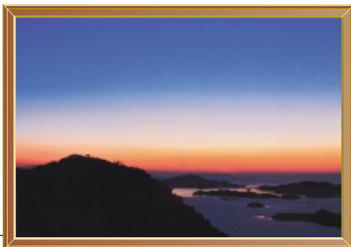
かぎろいの瀬戸 (平成23年2月) 撮影場所 竜王山

市民の皆さんからの投稿写真を紹介します。 作品は随時募集しています。たくさんの方の応募を待っています。