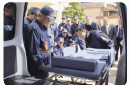
▲搬送車の説明を熱心に聞く消防団員たち

防署職員から、車両の装備品などの説明を受けた後、実際に車両を使用して搬送体験などを行いました。