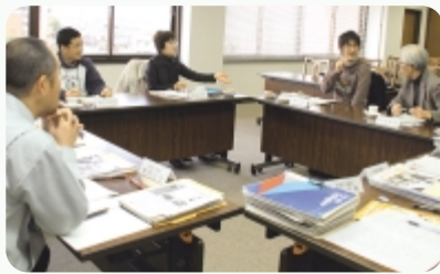
▲活発な意見交換がされたモニター会議

市では、今回の意見や提案を踏まえ、より分かりやすく身近に感じられる紙面づくりに取り組みます。