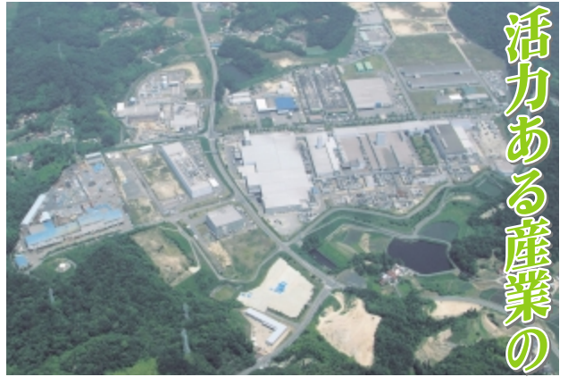
▲企業が立地する三原西部工業団地(小原地区)