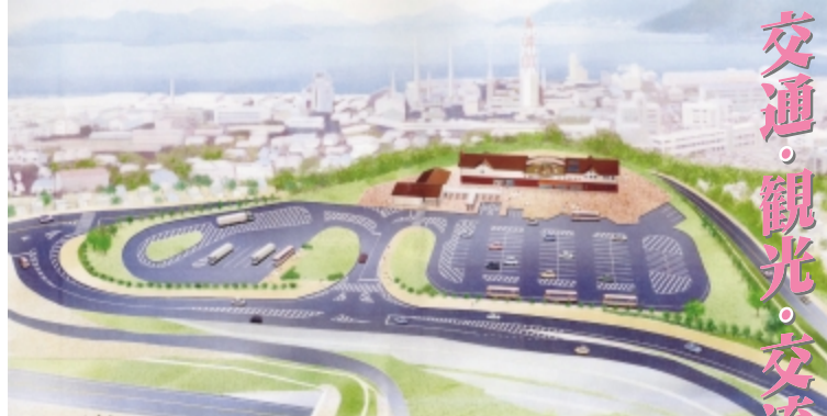
▲道の駅完成予想図