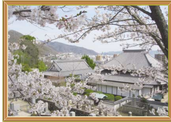
春満開！ (平成23年4月) 撮影場所 妙正寺(本町二丁目)