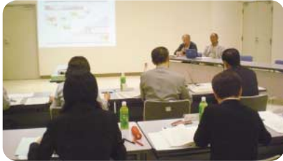
▲提案団体から企画の説明が行われた公開審査

4月に市民活動団体や町内会・自治会の皆さんから募集した提案の中から、書類・公開審査を経て、次の事業が、協働事業として採用されることになりました。 今後、提案団体と市の担当課などで、事業を実施するために役割分担などを協議し、各事業に取り組んでいきます。 活動のようすは、広報みはらや市ホームページなどで紹介していきます。 問い合わせ先 まちづくり推進課(☎0848 6184 FAX 0848 6199)