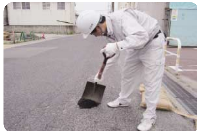
▲小規模なものは、道路パトロールなどの際に修繕しています

「ガードレールの設置」、「道路のくぼみ・穴の改修や舗装」、「側溝を直してほしい」、「道路沿いの除草について」、「歩道の段差を解消してほ