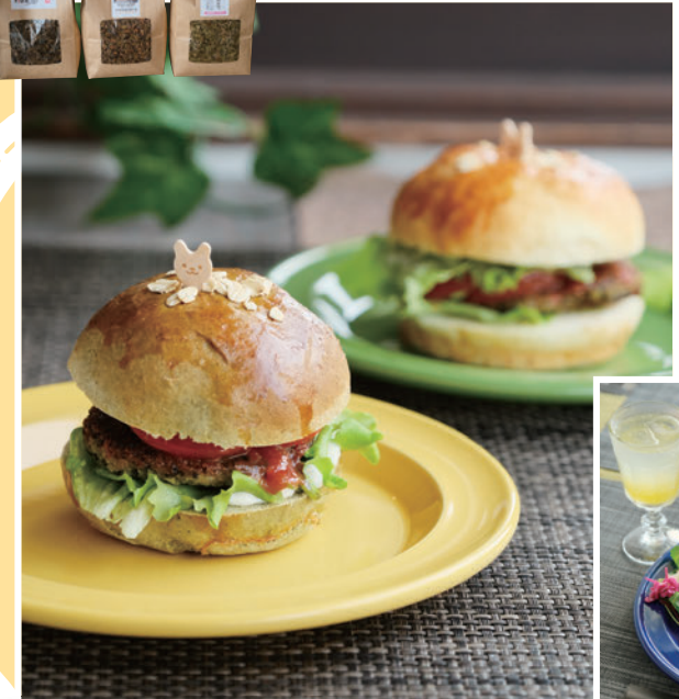
Anne's Kitchenの 抹茶バンズバーガー 680円

ほんのり抹茶が香る全粒粉のバンズに、スパイスのきいた黒大豆のパテがよく合う。コーンを練り込んだバンズも用意(写真奥)。どちらも数量限定