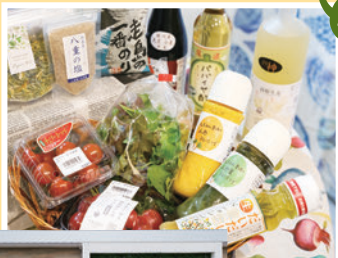
▲ミニトマトやハーブなどサラダ向けの野菜や、多彩な加工品を販売

📍三原市本郷町善入寺用倉山 10064-196 八天堂ビレッジ 空の駅オーチャード内