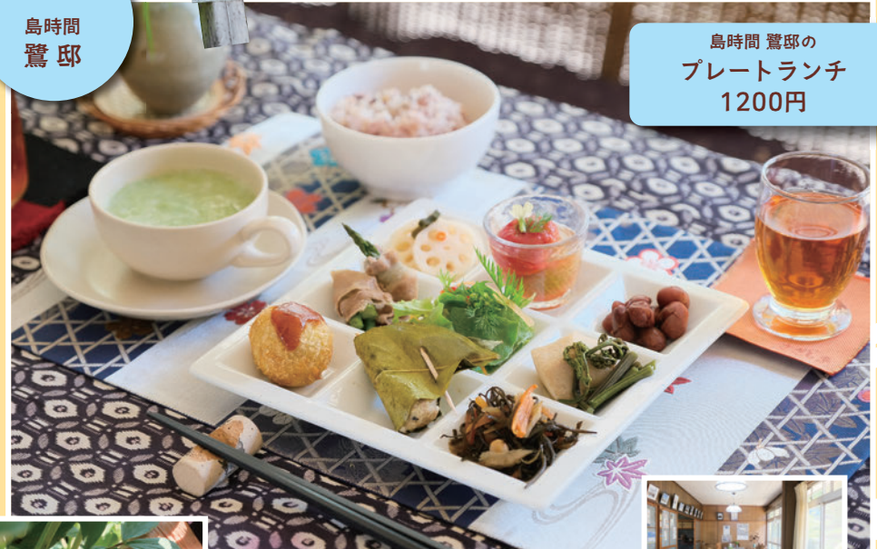
島時間 鷺邸の プレートランチ 1200円

▲雑穀米、野菜スープ、9品のおかずが盛られたプレート。これにコーヒーと手作りケーキが付く ▶テーブルクロスやランチ用マットなどの布小物は、白須さんのお手製