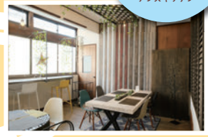
▲オーナーがDIYでつくった店内は、ブルックリンスタイルを和風にアレンジ

ほんのり抹茶が香る全粒粉のバンズに、スパイスのきいた黒大豆のパテがよく合う。コーンを練り込んだバンズも用意(写真奥)。どちらも数量限定