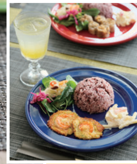
▲古代米、おかず、サラダ、地元産パイヤの西洋漬け、ドリンクが付く日替わりランチプレート各880円 (提供は~14時)