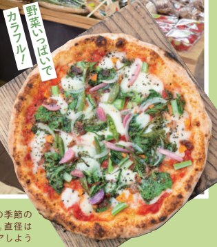
野菜のほじで カラフル!