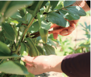
▲有機栽培で作る自家菜園の野菜。ランチで使う野菜は、その日の朝に収穫する