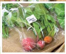
▲地元産の野菜からジビエ、イタリア直輸入の食材まで多彩にそろそろ ▶パジル、ピーズ、フィノッキオなどイタリア野菜も充実