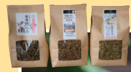
◀有機無農薬栽培で育てた世羅茶や、世羅茶で作ったお菓子を販売