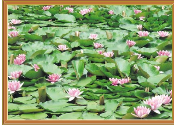
ため池を彩るスイレン 撮影 島田博司さん (平成23年7月) 撮影場所 高坂町