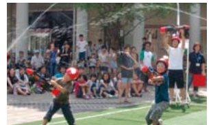
▲水鉄砲合戦のようす