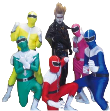
▲ゴミへらし隊エコレンジャー (協力:三原市民ミュージカル)