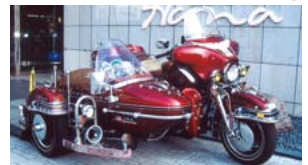
▲ハーレーダビッドソン 地元のプロたちが、腕を振るったおいしい料理を堪能してください。