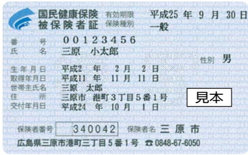
▲新しい保険証(見本)

今月1日から、国保の保険証が新しくなります。医療機関などで受診する場合は、必ず新しい保険証を提示してください。