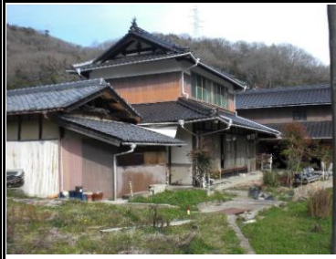
建物外観(物置・母屋)