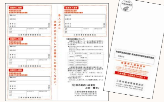
▲新しい投票所入場券は冊子版で、切り離して使います

投票時間・投票所 送付する投票所入場券に記載しています ◆投票所入場券が変わります 今までのがき版から冊子版が変わります。各人ごとに切り離して投票所へ持参してください。