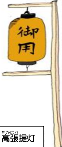
たかはり 高張提灯