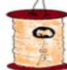
おだわら 小田原提灯