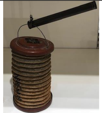
おだわらちょうちん 小田原提灯 ↑

最初につくられたといわれる形の提灯で、棒を差し入れると地面に置くことができます。たたむと円形の箱になります(左)。