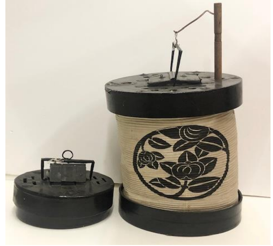
はこちょうちん 箱提灯

最初につくられたといわれる形の提灯で、棒を差し入れると地面に置くことができます。たたむと円形の箱になります(左)。