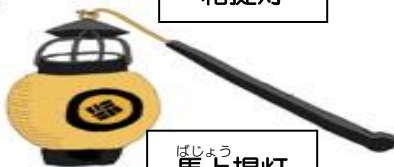
ばじょう 馬上提灯