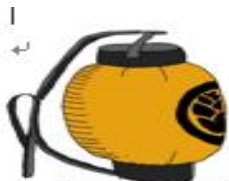
ゆみはり 弓張提灯