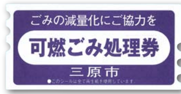
有料の可燃ごみ処理券(1枚50円)