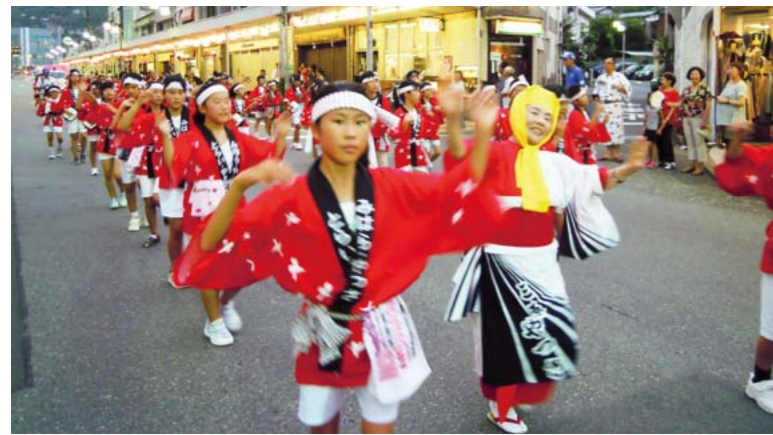
▲湯河原町での交流の様子

とき 8月2日(木)・3日(金) ところ 神奈川県湯河原町 内容 湯河原やっさ祭りへの参加、交流会など 対象 市内在住の小学5・6年生 ※保護者の同意が必要です。 定員 45人(多数の場合抽選) 参加費 無料 ※昨年参加した児童を優先します。 ※事前学習会(5回)への参加が必要です。 申し込み 5月25日(金)までに、申込書(青少年女性課、市ホームページに用意)を青少年女性課へ