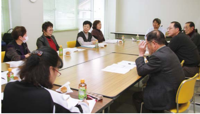
▲見守りサポート活動を進める上で、研修が行われています(第11民生区)

高齢化が進む中、一人暮らしや高齢夫婦、介護を必要とする家庭が増えていきます。それにより、外出する機会が減り、周りのふれあいが薄れてきています。 その結果、病气やけがで倒れても誰にも気付かれず、死に至ってしまう孤独死が社会問題となっただけではありません。こうした事態をできるだけ防ぐため、見守りサポート活動が進められています。 活動を進めるに当たり、民生委員が地域の皆さんや関係機関とどう協働していけばいいのかについて研修が重ねられています。 孤立や孤独という問題に対して、地域内で連携して取り組む体制の整備が図られています。