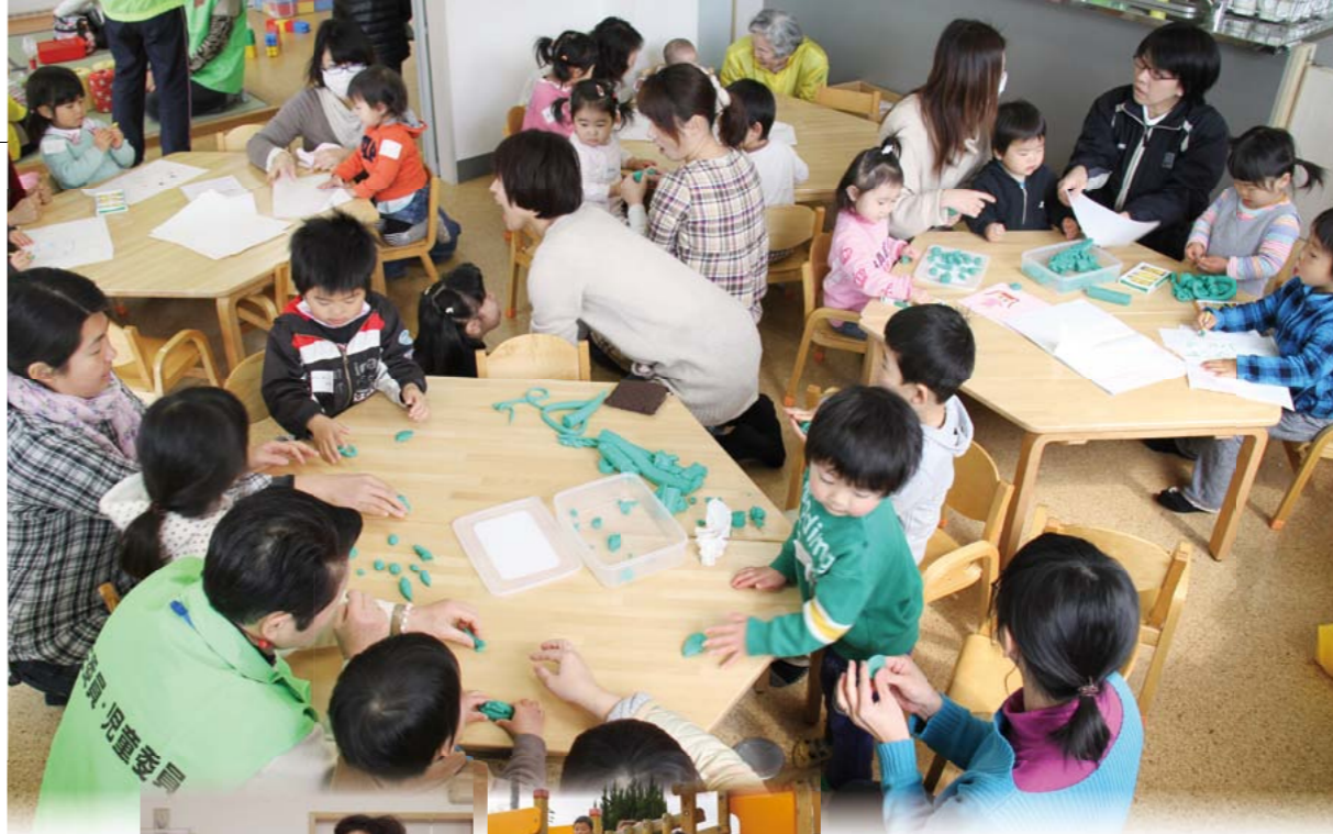
▲第6民生区の子育てサロンのようす