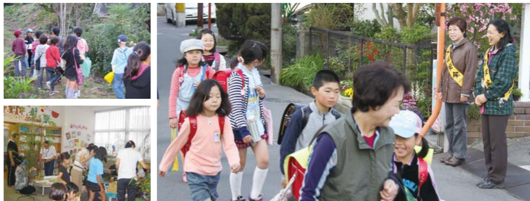
▲第4民生区の放課後子ども教室や登校時の見守り活動のようす

乳幼児とその保護者が集い、子どもが遊ぶことができ、親同士も交流できる場として、子育てサロンが開催されています。現在、14カ所で開催されているサロンの運営には、多くの民生委員や主任児童委員が関わっています。育児のストレスや不安を解消し、楽しく子育てをしてみたいという願いから開催されている子育てサロン。親子がいきいきと過ごせるよう、開催場所の環境整備や活動プログラム作りなどが行われています。