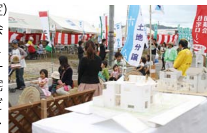
▲昨年開催したフェアのようす