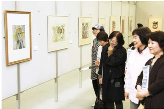
▲日本を代表する画家が描いた作品120点を展示しています

リージョンプラザで、13日(日)まで、サクラアートミュージアム所蔵クレパス画展を開催しています。 岡本太郎や山下清、寺内萬治郎など、日本を代表する巨匠の作品を一堂に展示しています。 子どもから大人まで、世代を越えて親しむことのできるクレパスの魅力が堪能してください。 ●クレパス画展 とき 13日(日)まで 10時～18時 ※入場は17時30分まで。 ところ リージョンプラザ 展示ホール 入場料 大人500円、大学生300円