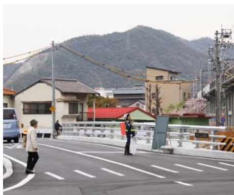
▲新しくなった梶新橋。今年度は仮設橋の撤去を行い、工事が完了します