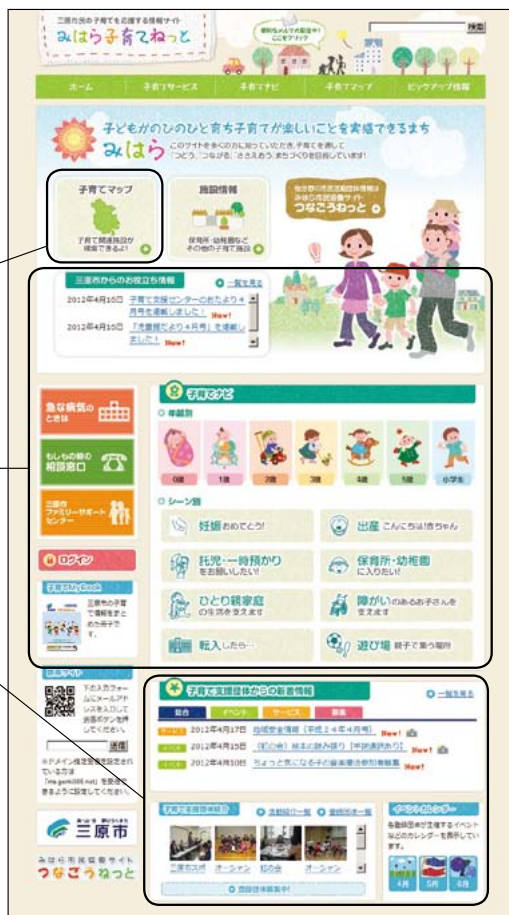
▲新しく開設した“みはら子育てねっと”