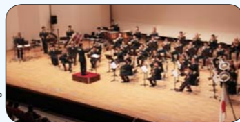
☎芸術文化センター ポポロ