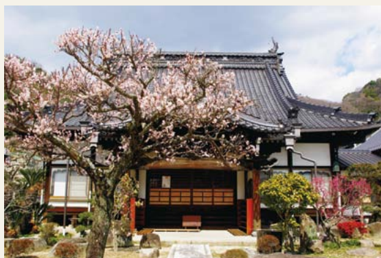
早春さんぽ 壽徳寺