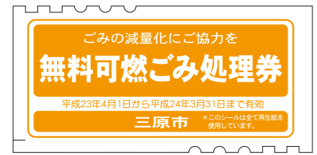
▲交換できるごみ処理券