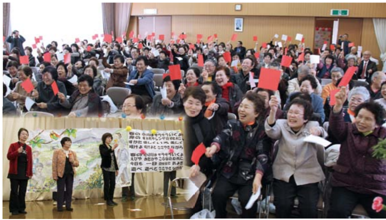
▲第3民生区で開催された、ふれあいサロン大会

高齢化が進む中、一人暮らしや高齢夫婦、介護を必要とする家庭が増えていきます。それにより、外出する機会が減り、周りのふれあいが薄れてきています。 その結果、病气やけがで倒れても誰にも気付かれず、死に至ってしまう孤独死が社会問題となっただけではありません。こうした事態をできるだけ防ぐため、見守りサポート活動が進められています。 活動を進めるに当たり、民生委員が地域の皆さんや関係機関とどう協働していけばいいのかについて研修が重ねられています。 孤立や孤独という問題に対して、地域内で連携して取り組む体制の整備が図られています。