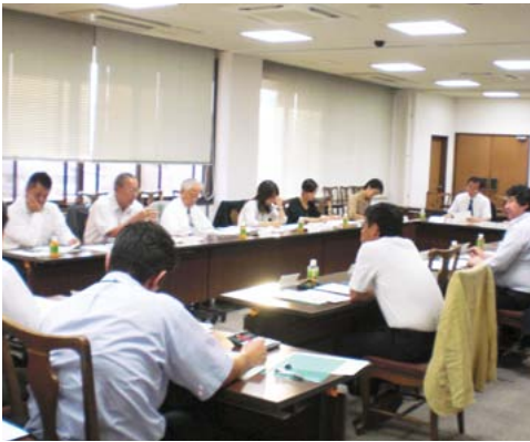
▲昨年9月に開催された委員会の様子

また、平成20年度から開催している市民協働のまちづくりフォーラムについても、企画段階から携わっています。