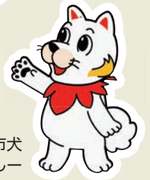
ひろしま都市犬 はっしー