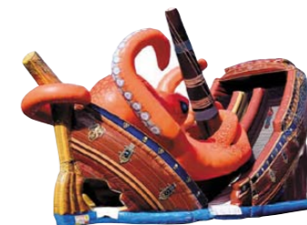
▲タコと海賊船のふわふわスライダー