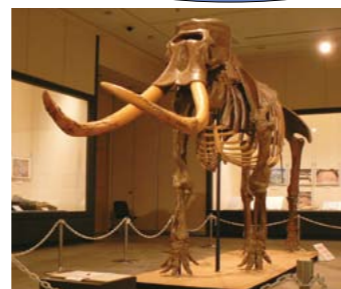
▲ナウマンゾウの化石標本などを展示

申し込み先 生涯学習課(〒723-0015 円一町二丁目3番1号 ☎0848・64・2137 FAX0848・64・0137)