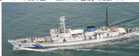
海上保安庁の巡視船

ところ 松浜岸壁(糸崎九丁目) 参加費無料 対象 小学生以上(小学生は必ず保護者同伴) 定員 各回約150人(多数の場合抽選) ※船舶の構造や安全上の理由から、健脚な人に限りません。 ※悪天候などにより行事の全部または一部が中止となる場合があります。 申し込み 6月15日(金)(消印有効)までに、往復はがきに代表者の住所・名前・年齢・電話番号、希望する時間、同伴者全員(3人まで)の名前・年齢を記入し、海フェスタ三原市実行委員会事務局(港湾課内〒723-0015 円一町二丁目3番4号 ☎0848・67・6108)へ ※返信用の表面には、代表者の住所と名前を記入してください。