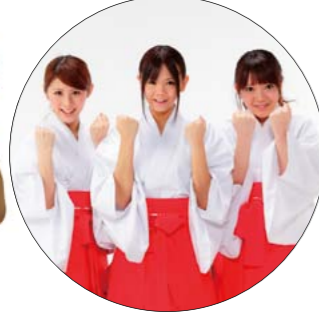
▶清盛ゆかりの地・広島を全国に発信する、ひろしま清盛 美少女隊