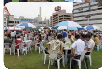
▲昨年のSea級グルメ全国大会の様子