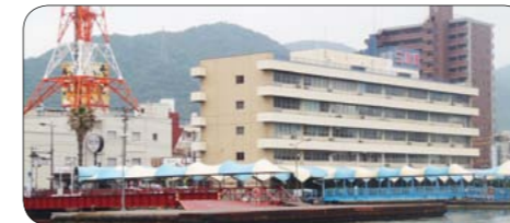
◀港湾ビル南側にカフェを設置します

☎政策企画課 ☎0848・67・6009)、みはらまちづくり 兎っ兎 ☎0848・63・5575)