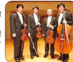
▲マイ・ハート弦楽四重奏団