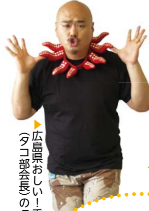
▶広島県おいしい！委員会(タコ部会長のクロちゃん)