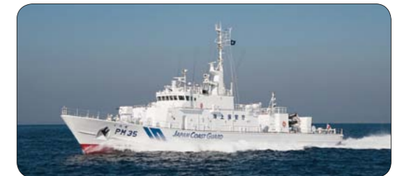
▲海上保安庁の巡視船「くろせ」