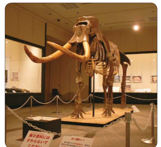
▲ナウマンゾウの化石標本などを展示

定員 400人(申し込み先着順) 申し込み先 生涯学習課(〒723-0015 円一町二丁目3番1号 ☎0848・64・2137 0848・64・0137)