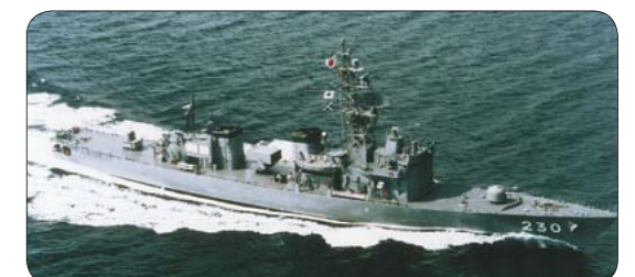
▲自衛隊の艦船「じんつう」