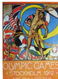
▲1912年のストックホルム大会のポスター