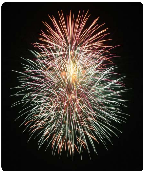
▲本郷の夜空に輝く2012発の大輪