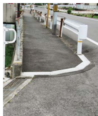
▲歩道の段差を解消しました