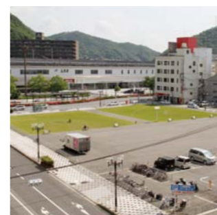
▲駅前東館跡地の活用については、今後、市議会で審議されます