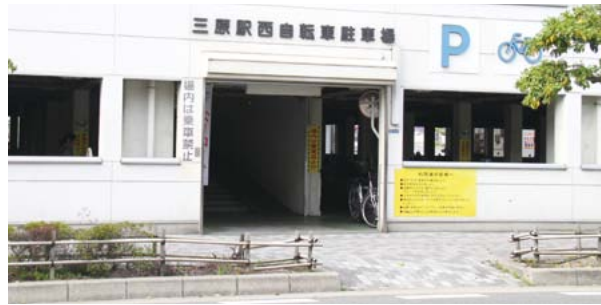
▲ 駐輪場を利用してください