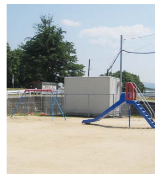
▲玉城児童遊園(小泉町)に滑り台とブランコを設置しました