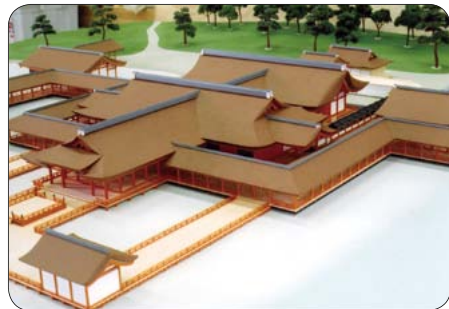
▲厳島神社の復元模型