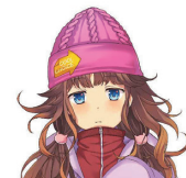
環境省COOL CHOICE MOE 萌えキャラクター