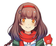
環境省COOL CHOICE MOE 萌えキャラクター