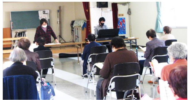
収録は11月半ば。「企画に参加するための収録です。」という緊張して声が出なくなるので、歌が終わるまで内緒でテープを回していたそうです。

コミセンの工事期間中はお休みされますが、4月からは再開。また美しく楽しい歌声を館内に響かせて下さいね。