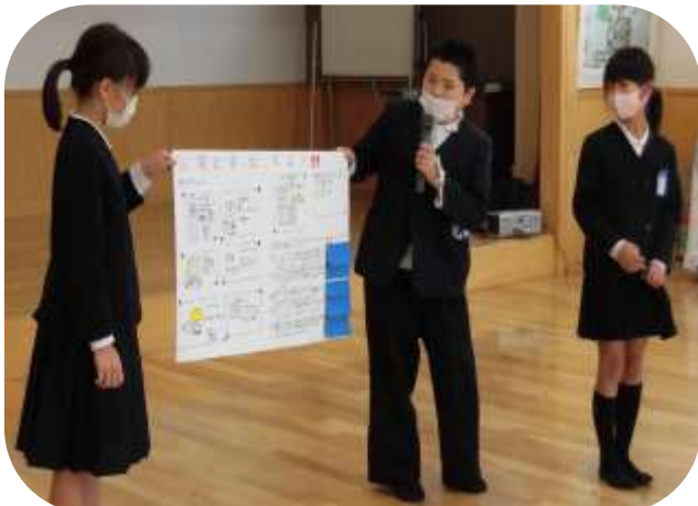
マイクと指示棒を使って発表する児童の皆さん。かっこいい!

参加者の皆さんも「よく調べているね。知らなかった事もあって、勉強になりました。」と喜ばれていました。