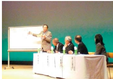
▲市民協働のまちづくりフォーラム「おいしい!三原～つなげよう ご近所の輪～」のようす

市では、市民の皆さんに協働のまちづくりへの理解を深めてもらい、まちづくりに参加するきっかけづくりとして、フォーラムや講座を開催しています。 昨年11月には、市民協働のまちづくりフォーラムを開催し、110人が参加しました。フォーラムでは、住民組織や市民活動団体からの活動報告を交えながら、地域の皆さんと行政が共に問題を解決していくことの必要性を考えました。