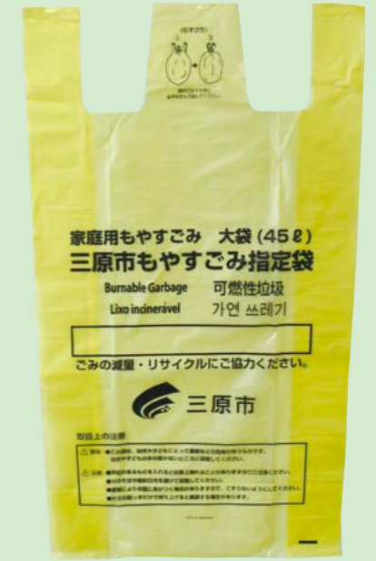
指定袋 大(45リットル) ※この他、中(30リットル)、小(15リットル)があります。

★注意 アパートなどの管理会社が、独自でごみの収集を行なっている場合(市の収集対象外のため、可燃ごみ処理券の貼り付け不要)は、対象外です。しかし、この場合も中身の見えない 黒色の袋は使用できません。