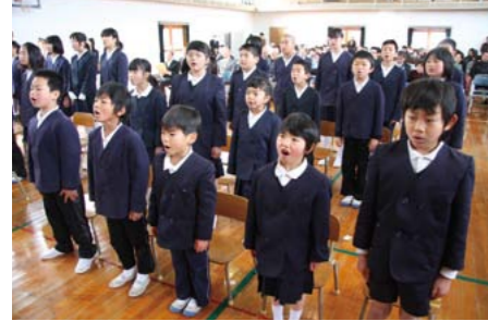
上：卒業生も加わり神楽を披露 下：慣れ親しんだ校歌を元気よく斉 唱(2/17 大草小)