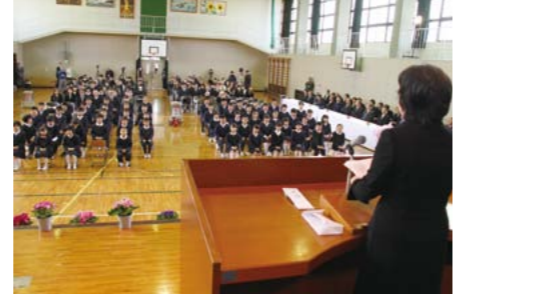
上：約 18 mの巻きずし作り 下：校長からのメッセージを聞く子 どもたち(2/10 久井南小)