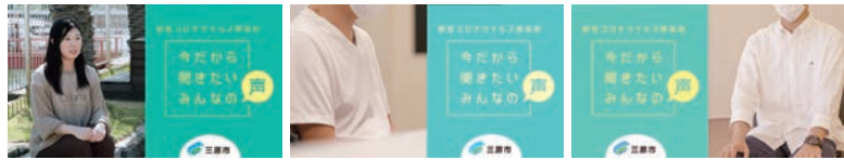
↑ワクチン接種者の体験談