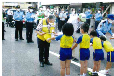
安全運動出発式における感謝状授与

利便性から、広島市のベッドタウンとして発展して来ました。さらには平成30年、中四国地区最大級といわれる大型商業施設もオープンし、快適な暮らしを満喫できる魅力ある佐伯区へと成長して来ています。一方では、近隣市区町からの人の往来も増えて、交通量が増加して来ており、交通事故の増加懸念も払拭できない状況となっています。