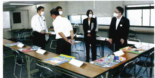
最終審査会の様子