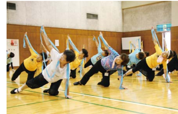
▲シェイプアップ3B体操教室のようす