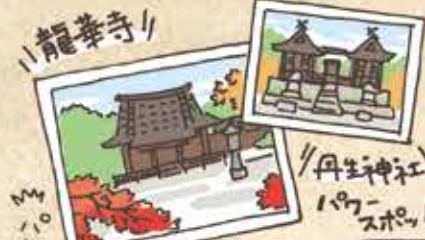
丹生神社 197-スポット