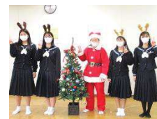
クリスマスパーティー (R2. 12. 13)