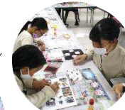
年賀状をつくらう！ (R2. 12. 19)

旧児童館から利用していましたが、今こんなにラフラフに多くの利用者が出て、笑顔で遊んでいる姿を見ると私も嬉しくなります。こうして地域の方と関わるうちに、もっと三原で多くの人と交流できる楽しい場所をつくりたいと感じるようになりました。これからも子ども達みんなの居場所のようなラフラフであってほしいと思います。