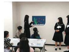
Let's try English! (R3. 3. 20)

teensスタッフとしてラフラフの色々なイベントに参加し、ラフラフに来なければ関わることができなかった人達と出会うことができました。私達自身が企画から運営まで全て行うイベントもあり、人前に出て話す力やコミュニケーション能力が身に付いたと感じます。 teensスタッフ 高3