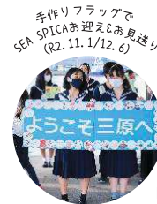
手作りフラッグでSEA SPICAお迎えとお見送り (R2. 11. 1/12. 6)