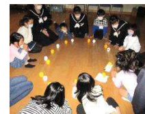
ハロウィンパーティー (R2. 10. 24)

teensスタッフとしてラフラフの色々なイベントに参加し、ラフラフに来なければ関わることができなかった人達と出会うことができました。私達自身が企画から運営まで全て行うイベントもあり、人前に出て話す力やコミュニケーション能力が身に付いたと感じます。 teensスタッフ 高3