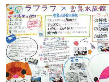
宮島水族館オンライン交流&壁新聞製作 (R3. 7. 23)