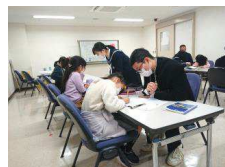
中学生と勉強しよう (R3. 3. 6)