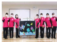
総高お元気マスター「ブラックシアター」 (R2. 12. 12)