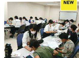
【R3年度新企画】ラフラフteens塾 (R3. 7. 25) 月1回程度開催予定！

私は将来、水族館のドルフィントレーナーになりたいと思っています。幼い頃、水族館でショーを見たことがきっかけです。ショーが始まる時のワクワク感と引き込まれる感覚に魅了されました。私もあんな風にお客さんを笑顔にできるドルフィントレーナーに絶対なる！みんなの夢は何ですか？ teensスタッフ 高3