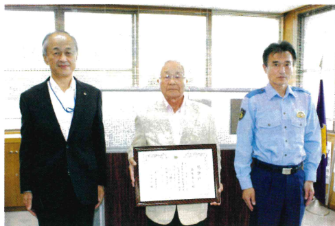
伝達の様子(島本前会長)