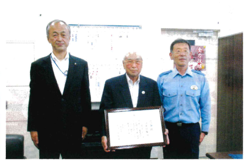
伝達の様子(中原前会長)