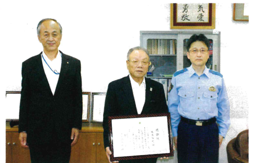
伝達の様子(塚本前会長)