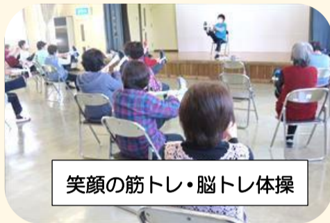
笑顔の筋トレ・脳トレ体操

「日常生活の中でコミセンでの活動がやりがいと生きがいでしたが、休止になり残念でなりません。でも感染拡大防止のためには仕方ありませんね」、「暑い季節のため自分への夏休みにします。少しでも自宅で練習をしたいと思います」、「再開は秋風が吹くころになりますが、その時のために身体を動かしておきます」と受講者は前を向いていました。