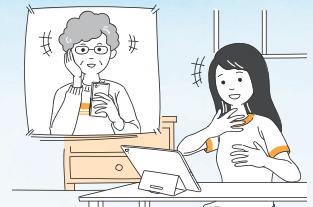
●家族や友人との会話