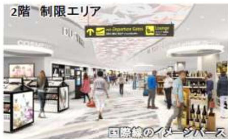
国際線のイメージパス