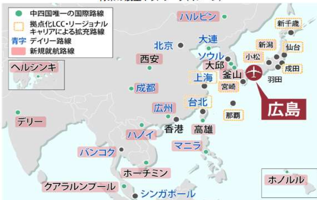
将来の航空ネットワーク(イメージ)