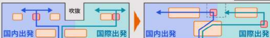
【現行（2階出発エリア）】

国内線と国際線を分断する吹抜部の屋内化による「旅客動線の改善」と「到着エリアの内際一体化」