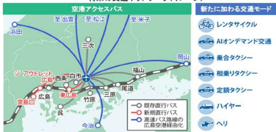
将来の交通ネットワーク(イメージ)