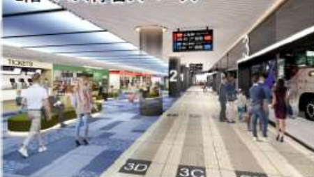
1階 バス待合スペース