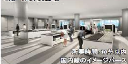
所要時間:10分以内 国内線のイメージパス