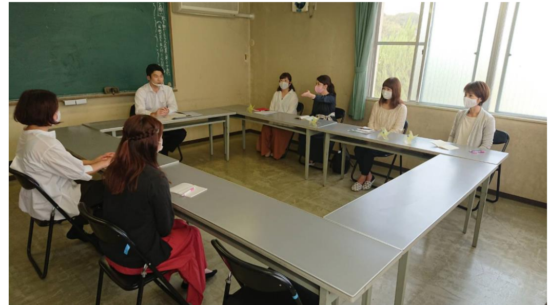
第1回 はっちはっち（10月12日）