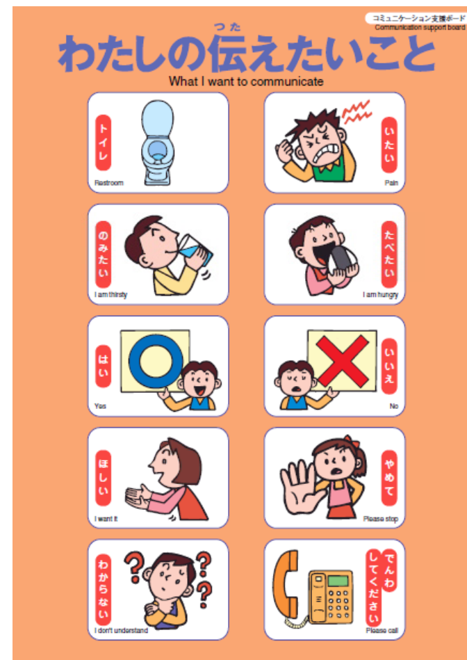
イメージ：コミュニケーション支援ボード

三原小学校, 第一中学校, 県立尾道商業高等学校, 第二中学校, 宮浦中学校, 田野浦中学校, 須波小学校, 南小学校, 第五中学校, 小泉小学校, 幸崎コミュニティセンター, 本郷小学校, 北方コミュニティセンター, 南方コミュニティセンター, 久井支所(久井保健福祉センター), 大和支所, 旧榎梨小学校(皆来館), 旧和木小学校(ふれあい)