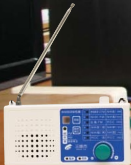
▲市から配布している FM告知端末ラジオ

皆さんはFMみはらを聞いたことがありますか。「コミュニティラジオ」「FMみはら」は、地域密着のラジオ局。身近な話題や暮らしに役立つ情報、緊急時や災害時のきめ細かい情報提供を行なっています。また、多くの市民に生出演・電話出演してもらい、まちの魅力も届けています。 問 FMみはら(☎0848・670874) 災害情報を広く周知することを目的に開局 FMみはらは平成30年5月に災害情報を広く周知することを目的に開局しました。乾電池でも動くラジオはテレビやインターネット、スマートフォンと異なり、停電時でも機能する情報媒体です。災害時には市と連携した情報の配信や気象情報、交通情報、避難所情報などをいち早く発信します。市が全世帯に配布しているFM告知端末ラジオ(左)は持ち運び可能で簡単に操作できるため、災害時にも便利です。