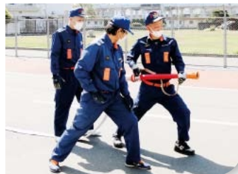
先輩団員(中央)から放水器具の使い方を教わる新入団員▶