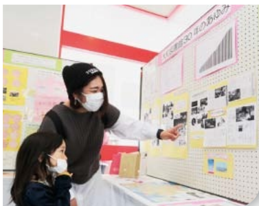
パネルで図書館の歴史を振り返る親子▶

平成2年度に開館した大和図書館は3月27日、「大和図書館30周年感謝祭」を開催しました。当日は人形劇やワークショップ、講演会などのイベントが開かれたほか、稲作体験ができる家庭用ゲームの解説や大和図書館の歴史が分かるパネルの展示が行われ、子どもからお年寄りまで、思い思いに催しを楽しみました。