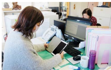
▲遠隔地でも業務が行えるようタブレットなどを導入しています