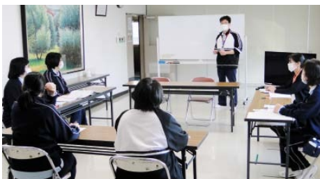
▲研修などにより業務の効率化とサービスの向上を図っています