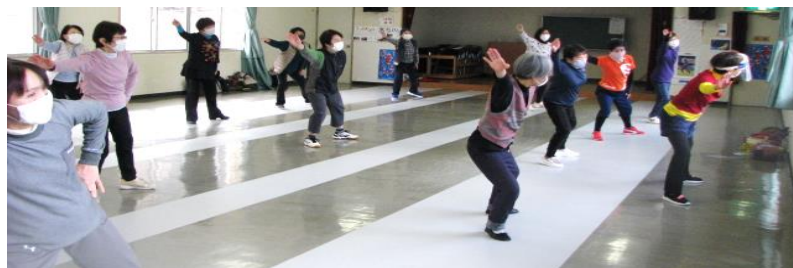
久しぶりの運動に, 終了後筋肉痛ぎみの参加者もおられました, 翌日には「身体が軽いわ!」と喜びの報告もありました♪。