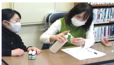
何種類もの精油を配合して「かぜジェル」を作ってみました。