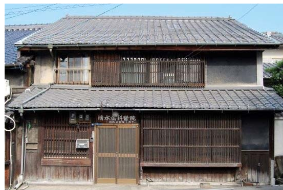
▲改修前の古民家しみず(本町3丁目)