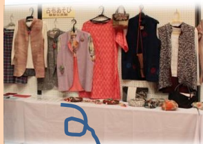
昨年の生涯学習発表会の一部です。

尚、2月のコロナ感染状況により中止の判 断を余儀なくされた場合は、お許しください。